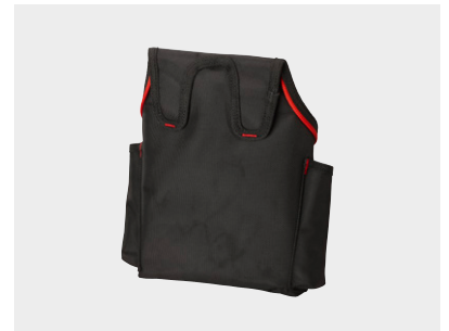
Verktøyholderen festes enkelt i beltet.