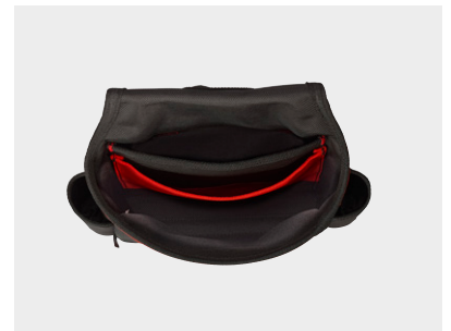
To sidelommer gir rask tilgang til verktøyene du bruker mest.