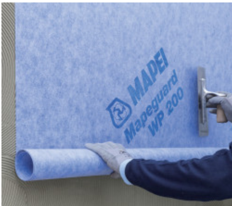
Montering av Mapeguard WP 200

Dersom systemet skal installeres på andre overflater eller i andre miljø eller andre bruksområder anbefales det å ta kontakt med Mapeis tekniske avdeling for rådgivning.