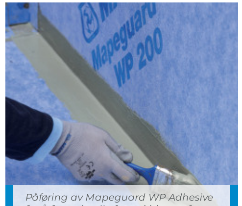
Påføring av Mapeguard WP Adhesive for å forsegle alle fuger i hjørnet før påføring av Mapeguard ST