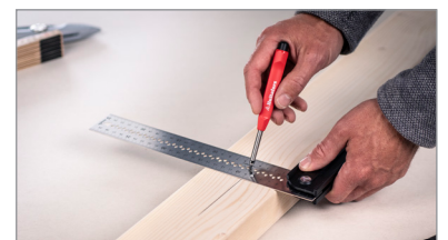
Klinge med rissespør.

Et robust ledd og en klinge av 1 mm tykt rustfritt stål gir et svært holdbart design som tåler tøffe arbeidsmiljøer. Nøye utvalgte materialer og produksjonsteknikker, slik som CNC-frest anslag og klinge skåret ut med laser, gir stor nøyaktighet; vinkeltoleranse \pm 0,06^\circ ( \pm 1 mm/m).