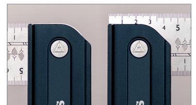
Skarpt ytre hjørne ved 90°, avrundet ved 270°.