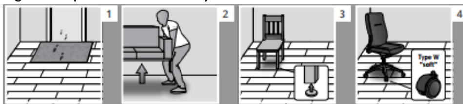
Fig. 4 Klar plastmatte må benyttes under kontorstoler.

Gulvmatter og tepper kan legges på gulvet etter 2 uker.