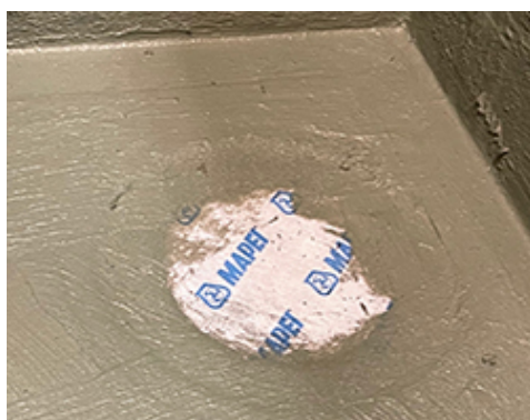
Mapeband B DC montert over sluk og smurt med Mapeguard WP 2K Membrane før klemring monteres