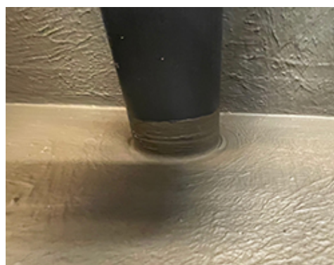
Mapeguard PC mansjett smurt over mansjetten med Mapeguard WP 2K Membrane