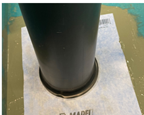
Installasjon av Mapeguard PC rørmanjett med Mapeguard WP 2K Membrane