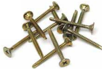
Aquapanel® Maxi Skruer SB