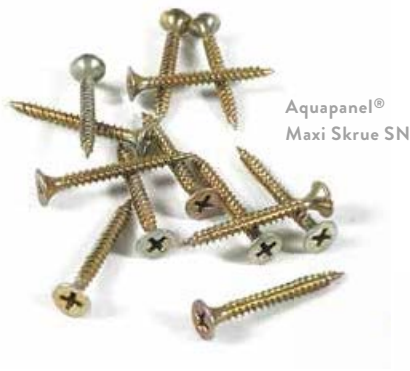
Aquapanel® Maxi Skruer SN