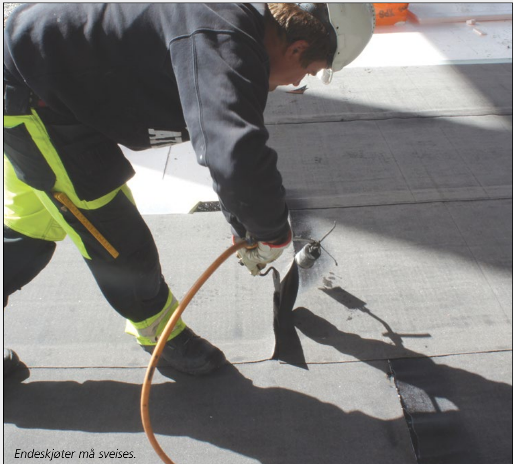
Endeskjøter må sveises.

Radonmembranen vil samtidig fungere som en svært solid fuktsperre.