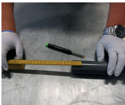
Mål opp innstikket på røret.