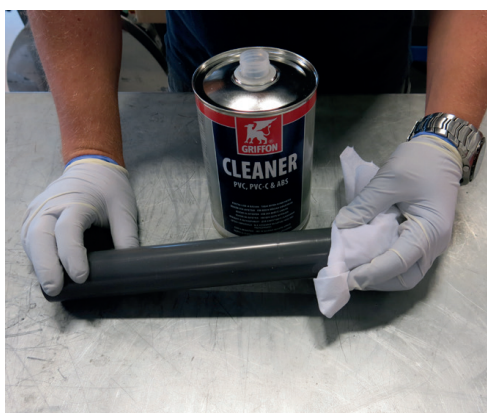
Rengjør rør og rørdel.