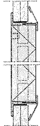
Fig. 1 TS Inspeksjonsluke. Branmotstand 30 minutter.