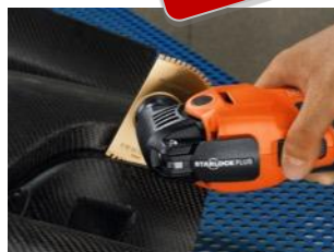
GFRP / CFRP sagblad