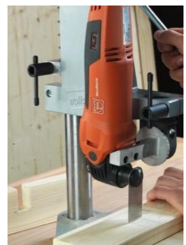
Holdeinnretning for bord