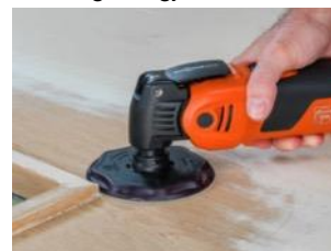
Slippeplate Ø 115 mm