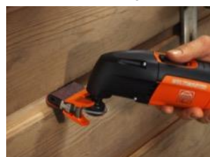
Profil pusse sett