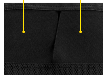
3 Slitesterk og pustende mesh.