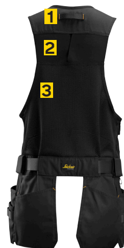
1 Slitesterk henge.