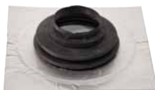
Rørmansjett, selvklebende butylkrage