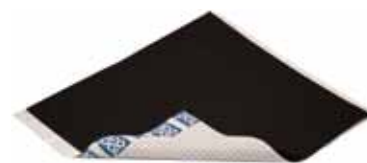
Universal Rørmansjett for utstansing