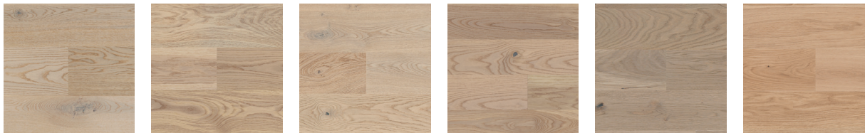
Professional Oak Cream Plank XT