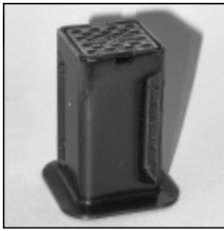
NRF nr. 33 45 53