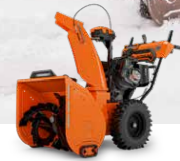
PLATINUM 24 SHO EFI GREAT LAKES EDITION™