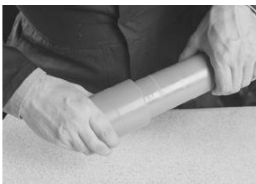
Press delene sammen, unngå å vri delene!