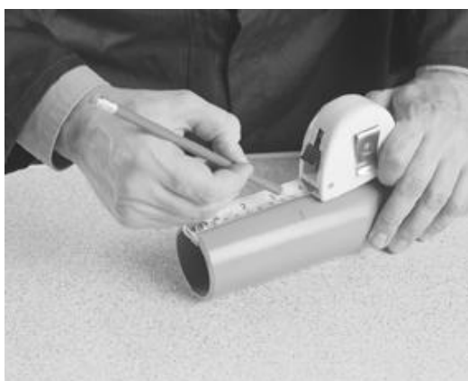
Mål opp innstikket på røret.