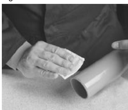
Rengjør rør og rørdel.