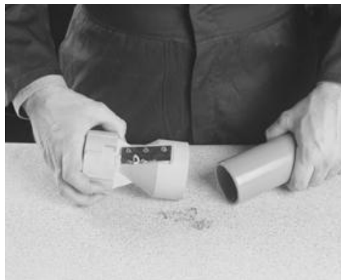
Fase røret. Ta vekk grader på innsiden og utsiden av røret.