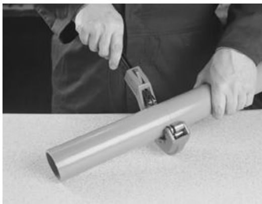
Kapp røret vinkelrett.