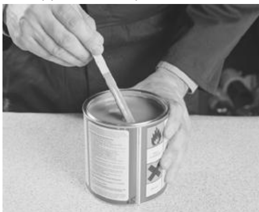
Rør godt om i limet før bruk.