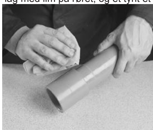
Tørk av overflødig lim.